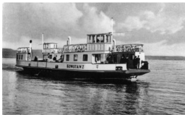
Die erste Selbstfahre Konstanz - Meersburg auf dem Bodensee im vollen Fahrt

Gebaut wurde das Schiff 1928 auf der Bodanwerft in Kressbronn.